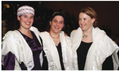
רבנות ביום הסכנתן, טכון שבספר, ירושלים, ישראל.

ביהדות האורתודוקסית נשים אינן מוסמכות לרבנות ואינן משמשות שליחות ציבור בבית הכנסת. בקהילות נאו-אורתודוקסיות מעטות נשים משמשות בתפקידים ציבוריים בקהילה וממלאות תפקידים מסיימים בתפילה.