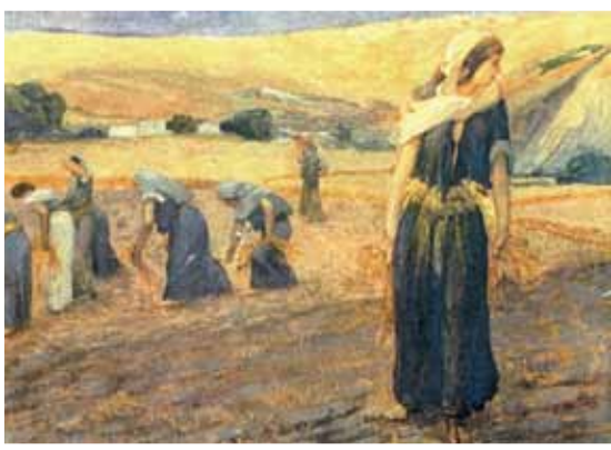
רות קוצרת, ג' ג'יימס טיסו, 1896-1902

וַתֵּלֶךְ וַתְּבֹא וַתִּלְקֹט בַּשָּׂדֶה אַחֲרֵי הַקְּצִירִים. (רות, פרק ב' פסוק ג')